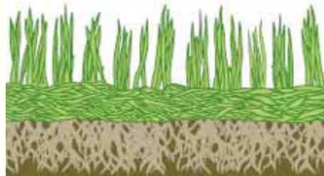
Ungepflegter, verfilzter Rasen

um rund 20 bis 40 Prozent und nährt deshalb den Rasen kontinuierlich in richtigem Maß. Sein Erscheinungsbild verbessert sich, Moos und Unkraut haben es deutlich schwerer, Fuß - bzw. Wurzel - zu fassen. Noch ein Vorteil: durch Mulchen wird zusätzlicher Dünger überflüssig und Sie sparen nochmals Geld. Sie brauchen auch nicht zu befürchten, dass der