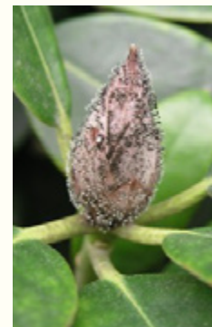
Knospensterben am Rhododendron weist auf Befall hin - eine Behandlung ist dringend notwendig

Rhododendren, zu denen auch die Azaleen zählen, bevorzugen lichten Schatten.