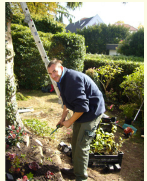
Liebe zu den Pflanzen und eine gute Hand ist bei Baumgart-Ganz-Natur! Voraussetzung

Viel Arbeit? Keine Sorge, wir von Baumgart – Ganz Natur! gehen Ihnen dabei gerne zur Hand. Mit Rat und Tat!