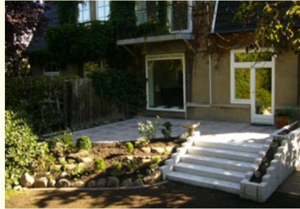
Schön und preiswert: Vielleicht gefällt eine Kombination aus Alt- und Neumaterial?

Haben Sie in diesem Winter auch in Ihren schneevehüllten Garten geblickt, unberührtes Weiß genos-