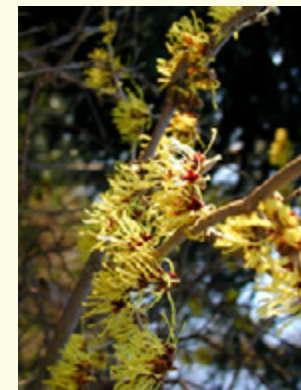
Muss eine Zaubernuss geschnitten werden? Und wenn, wie? Wann? Wie viel?

Wir von Baumgart – Ganz Natur! wissen das natürlich. Und wir stellen Ihnen gerne unser fachliches Auge zur Verfügung - das sieht